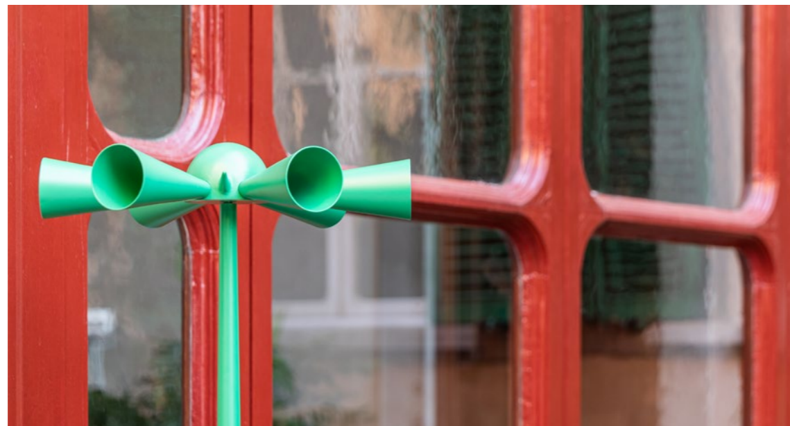
↵ Palazzo Budini Gattai, Firenze. 2022