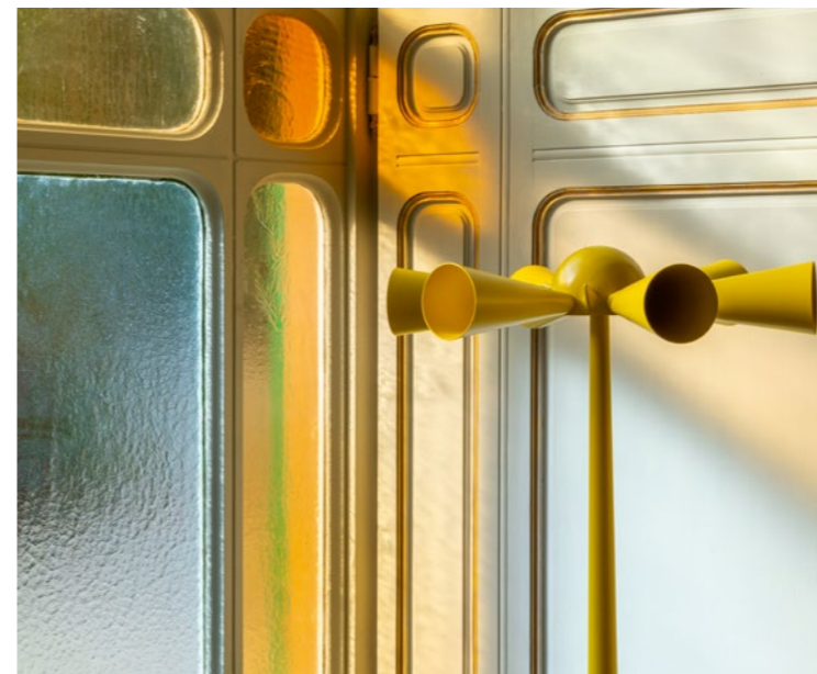
↵ Palazzo Budini Gattai, Firenze. 2022